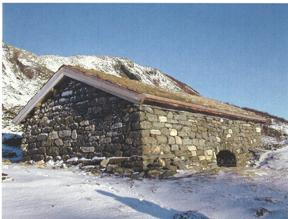
Sommerfjøs, Løvøy, Steigen kommune

* tilskudd til skogsveier/drift i bratt/vanskelig terreng til Fylkesmannen