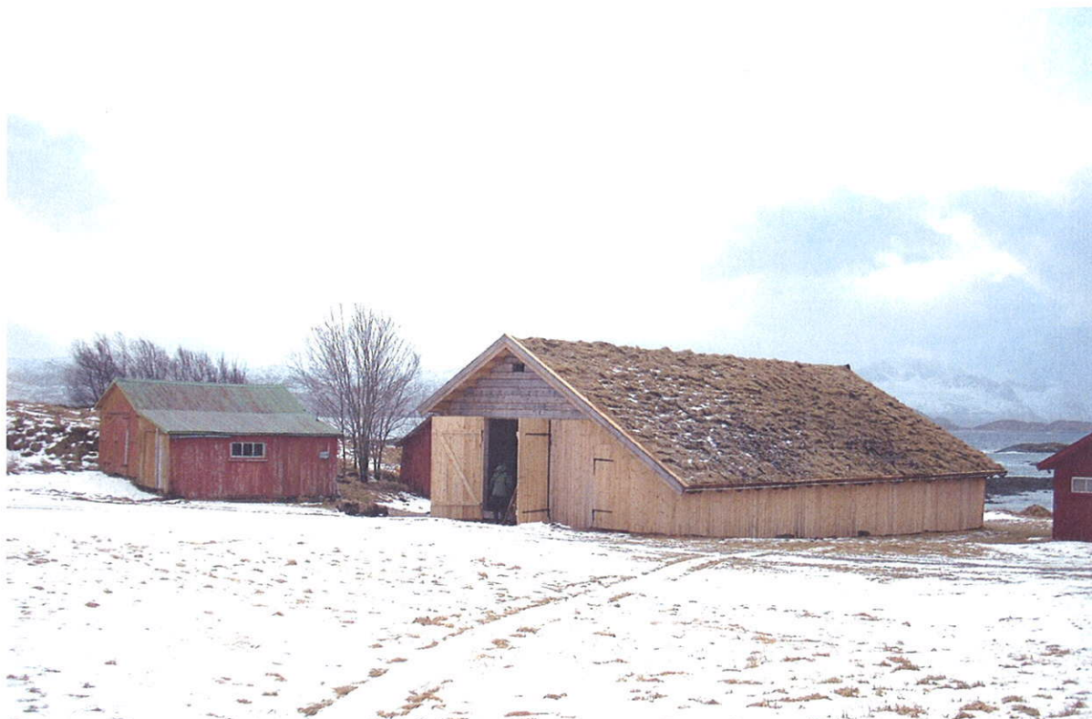
Fembøringsnaust. Håsand. Steigen kommune

Vedlikehold av bygningsmassen i landbruket har stor betydning for landskapsbildet i Nord-Salten. Den eneste måten en stor del av bygningsmassen kan holdes vedlike, er ved at den fortsatt er i bruk og er til nytte, enten som driftsbygninger i landbruket eller til nye formål. Det har også stor verdi at et utvalg særlig verdifull bygningsmasse restaureres og tas vare på som dokumentasjon og viktige kulturminner.