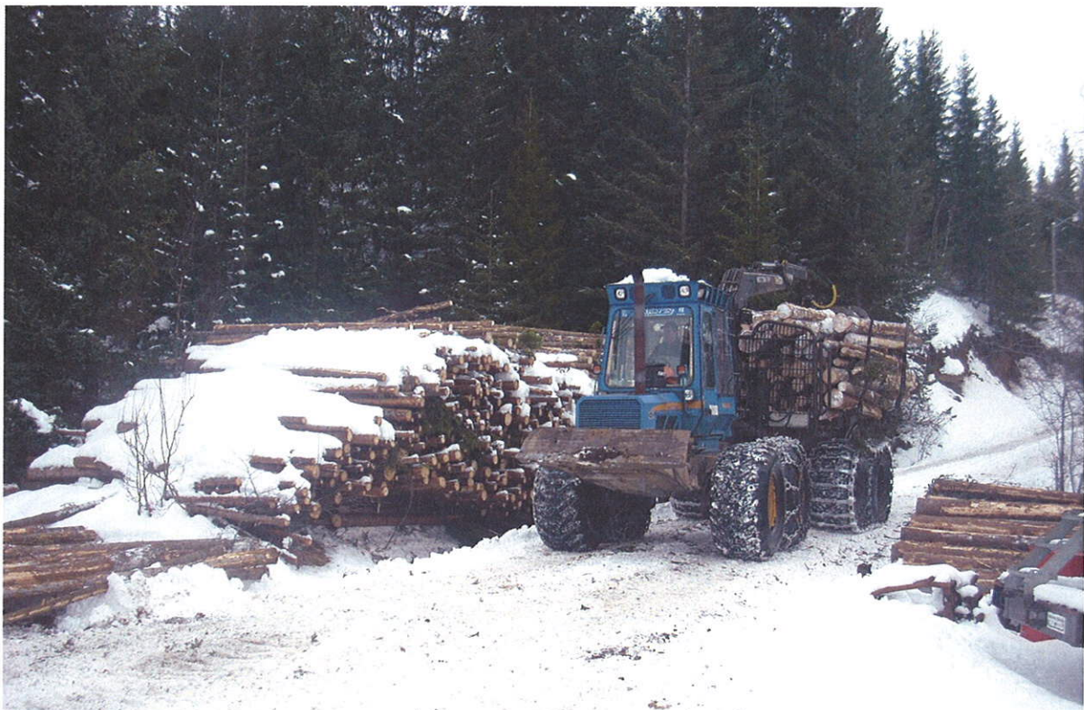
Skogsdrift. Nordfoldlia. Steigen kommune

Skogbruksetaten vil arbeide aktivt for at alle ordningene gjøres kjent hos skogeierne og næringsutøverne. Oppsøkende virksomhet vil fortsatt prioriteres.