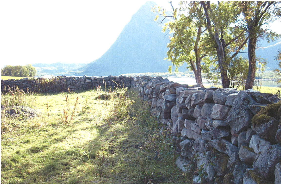
Skagstad. Steigen kommune