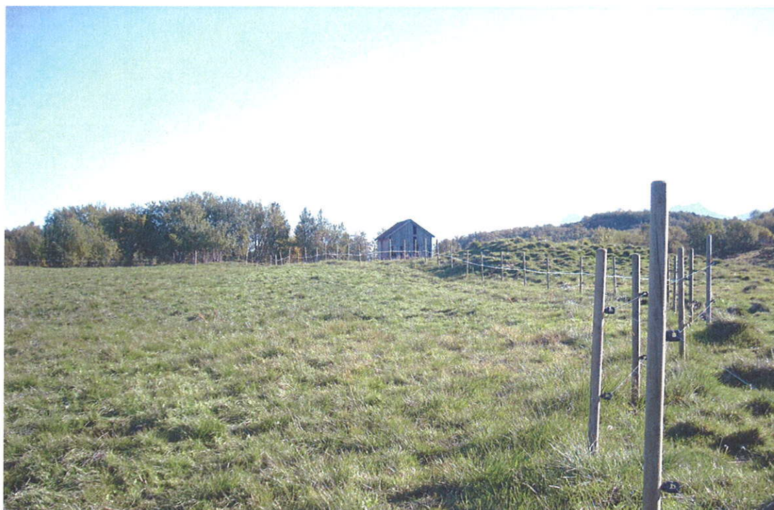
Kulturbeite. Røtnes. Steigen kommune