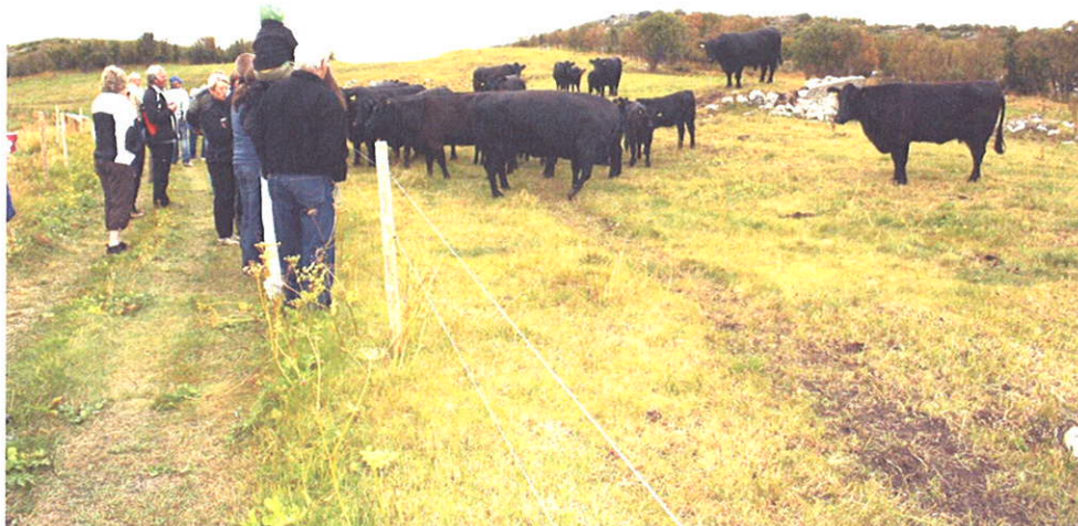
Tysnes. Tysfjord kommune