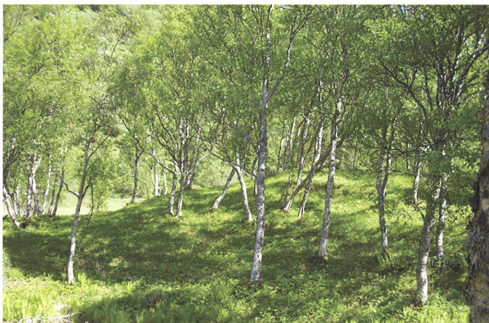
Beiteli. Hamarøy kommune