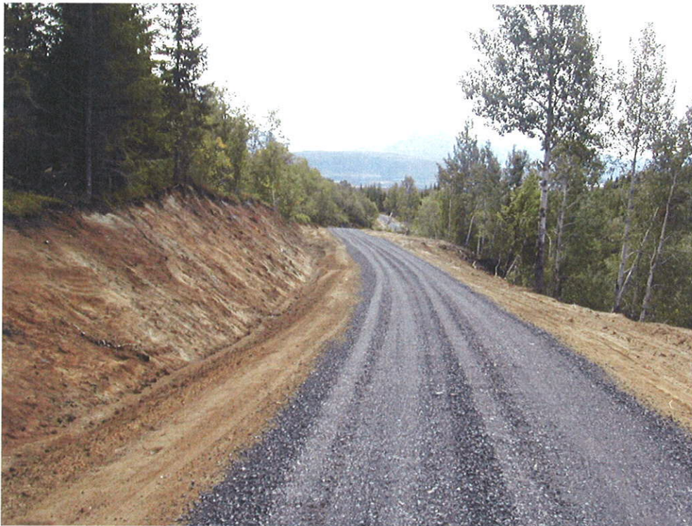
Skogsbilvei, Hansbakk, Hamarøy kommune