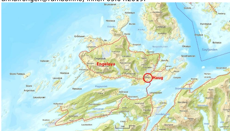
Figur 1: Oversiktskart, Haug/Ålstad er markert med rød ring.