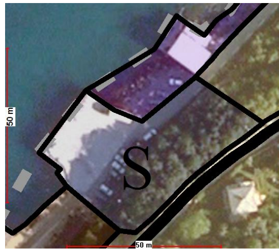
Innstilling til sluttbehandling