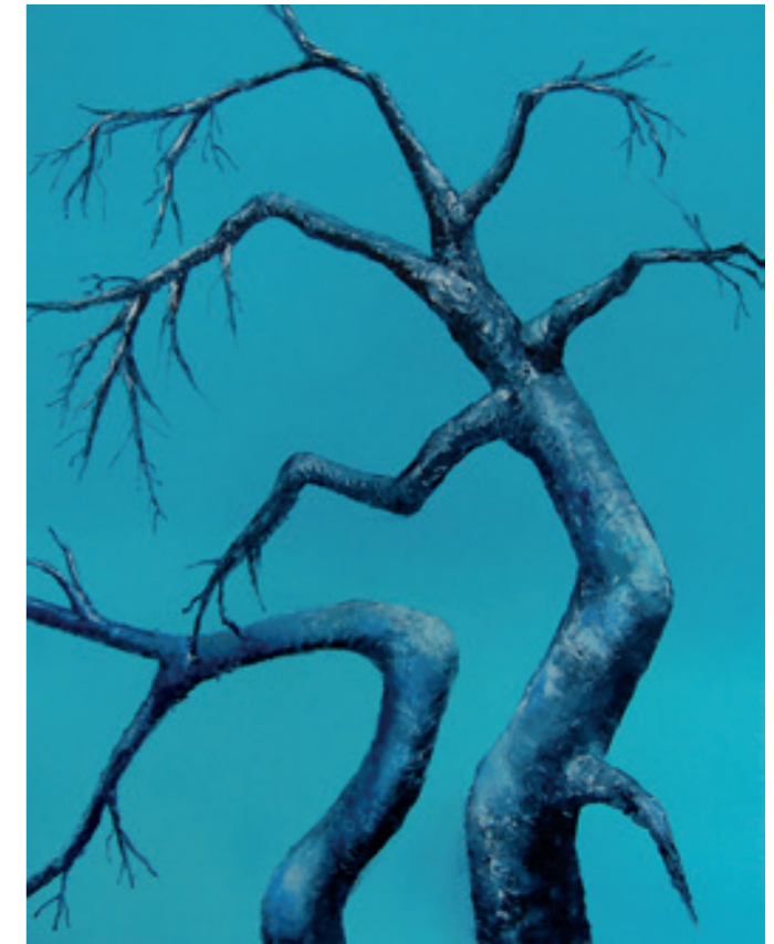
«Bjørk» av Ingunn Judith Moen Reinsnes

Tradisjonen tro har vi samlet alle utstillere vi vet om i Steigen i en folder. Slik blir det lett å finne fram. Det er et variert og godt galleritilbud vi byr på, med kunst og kunsthåndverk av profesjonelle kunstnere så vel som dyktige amatører.