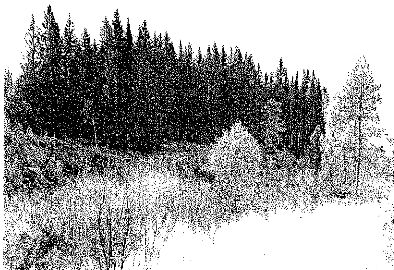
Finnøy, Hamarøy kommune

Det vises til " Regler om tilskudd til skogsdrift i vanskelig terreng i Nordland " gjeldende fra 01.01.2007