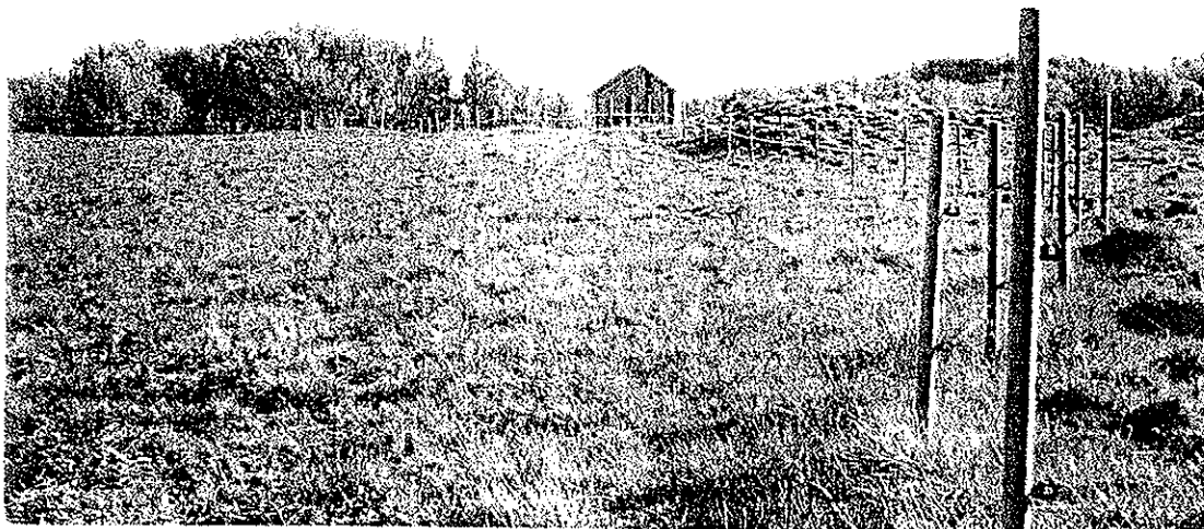
Kulturarbeite. Røtnes. Steigen kommune