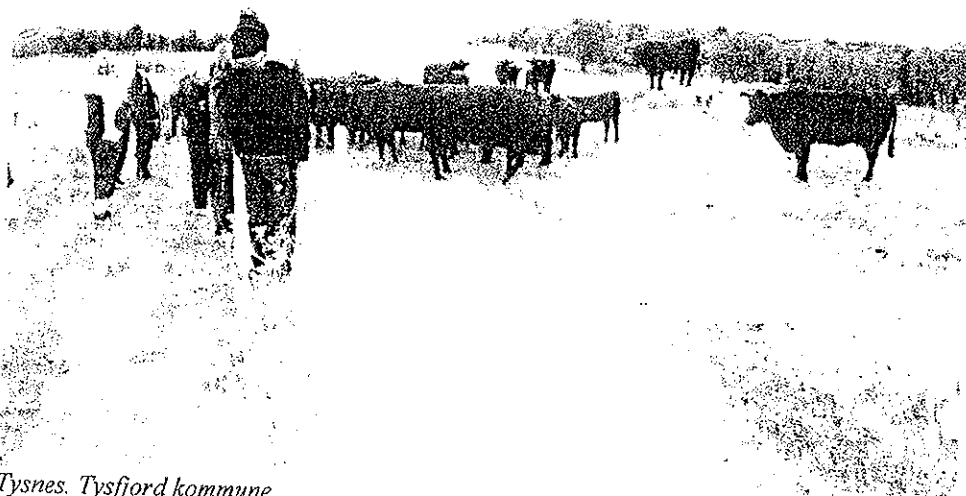
Tysnes. Tysfjord kommune