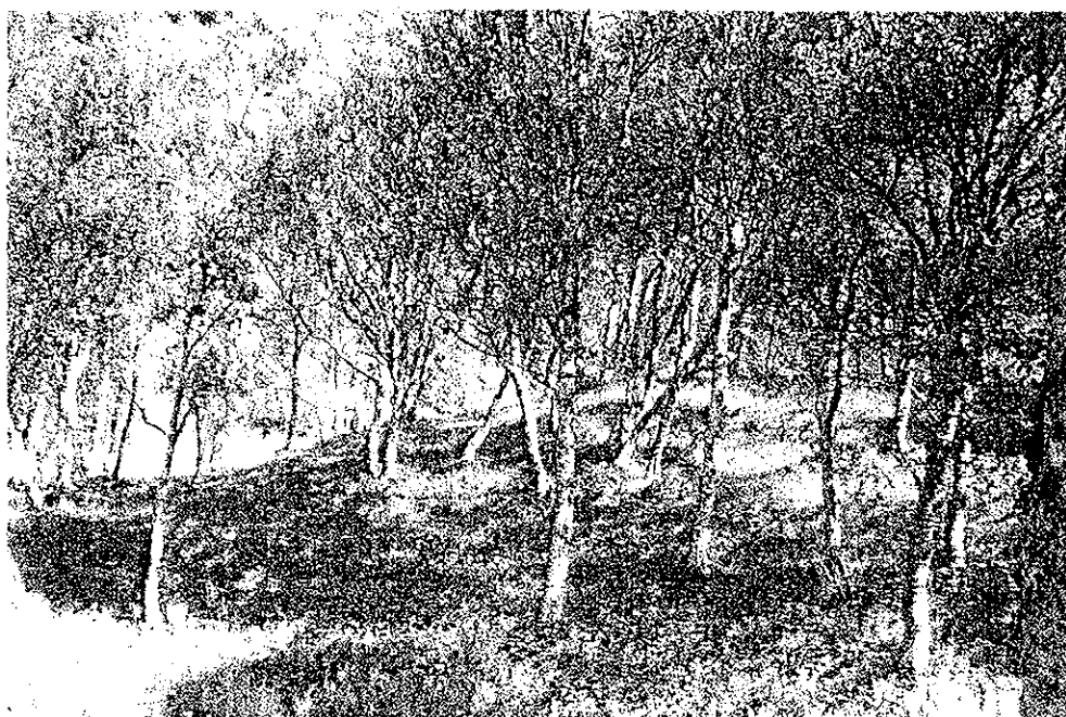
Beiteli. Hamarøy kommune