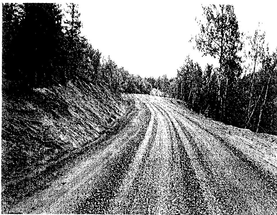
Skogsbilvei. Hansbakk. Hamarøy kommune