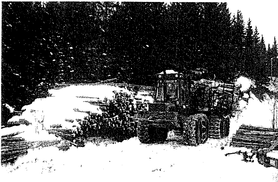
Skogsdrift. Nordfoldlia. Steigen kommune

Skogbruksetaten vil arbeide aktivt for at alle ordningene gjøres kjent hos skogeierne og næringsutøverne. Oppsøkende virksomhet vil fortsatt prioriteres.