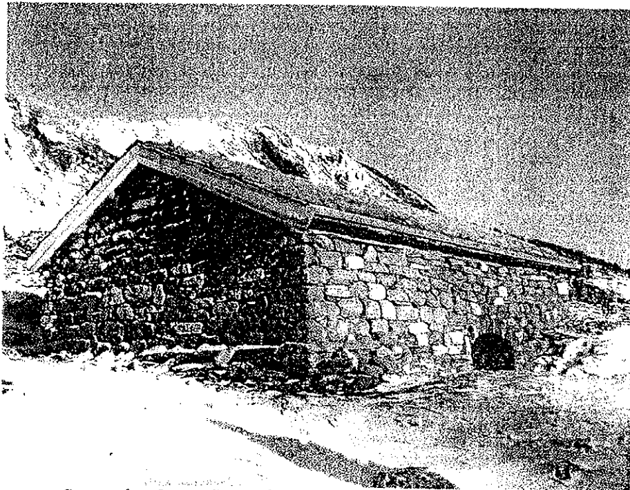
Sommerfjøs, Løvøy, Steigen kommune

* tilskudd til skogsveier/drift i bratt/vanskelig terreng til Fylkesmannen