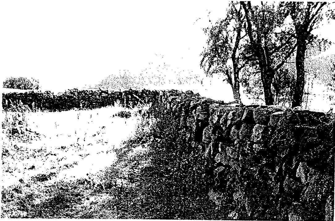
Skagstad. Steigen kommune