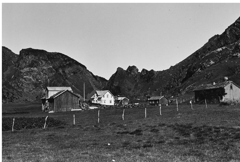
Steigen – Engeløya, foto: Anders B. Wilse, 1938

Når nye tiltak iverksettes i UKL-området vil det bli lagt stor vekt på å innhente bilder før og etter gjennomføringen.