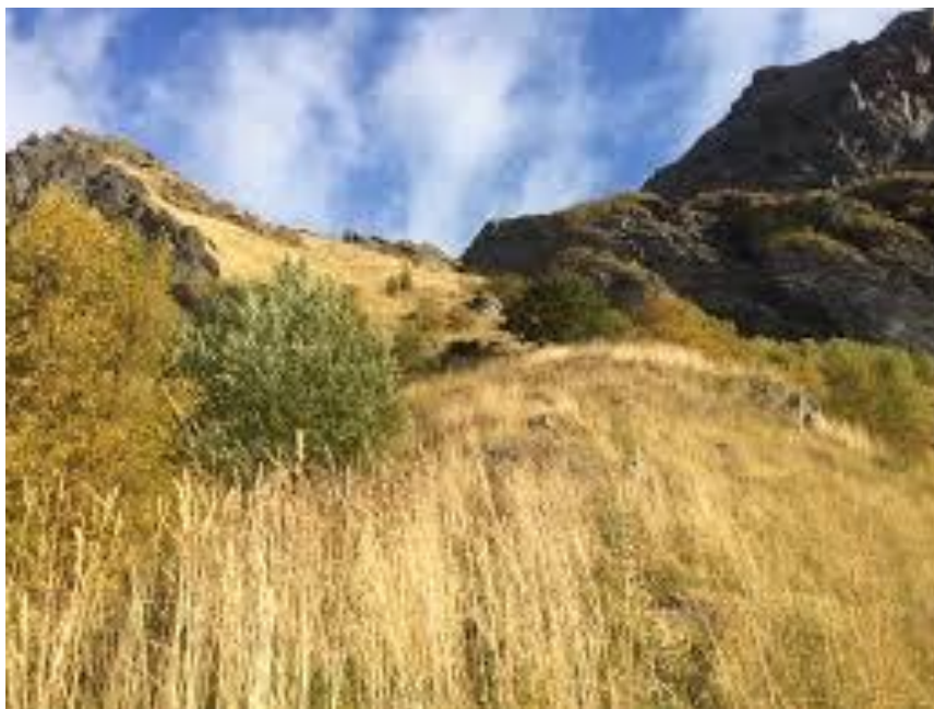
Sørvendt beiteli, ved Hanekammen

I området med edellauvskog vokser også en rekke andre kravfulle planter som skogvikke, kratthumleblom, vanlig knoppurt og fagerknoppurt.