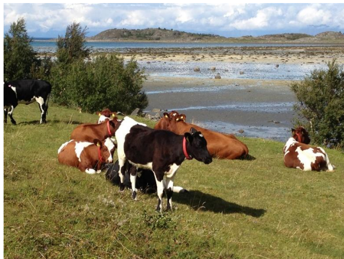
Storfe på beite Steigebergvika

En er ikke kjent med at det foreligger planer om inngrep som vil kunne redusere kulturlandskapsverdiene.