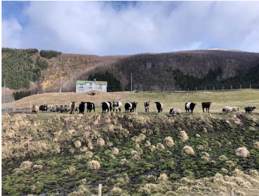
Beitedyr, Myklebostad