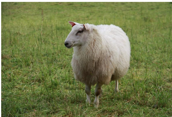
Steigarlam , foto Fred Hansen, Steigen

Melk er hovedproduksjonen på Engeløya og i Steigen. De siste 10-12 årene har det vært fem bruksutbygginger til lausdrift på øya. Det er nå 11 melkeprodusenter i drift. Gjennomsnittlig melkeproduksjon pr bruk ligger på ca. 250.000 liter. Selv om flere bruk er lagt ned, blir jorda høstet som tilleggsjord til de største brukene. Kun små og tungdrevne arealer i enkelte områder ligger brakk. Saueproduksjonen har tatt seg litt opp de siste åra. Et nytt sauefjøs med plass til ca. 430 vinterfôra sauer sto ferdig for noen få år siden. Engeløya har gode og rovdryrfrie utmarksbeiter som kan utnyttes bedre. En utfordring er at det blir færre og færre bruk i drift også på Engeløya. En god del innmarksbeiter og noe dyrka mark på mindre teiger som tidligere var i bruk, ligger nå brakk, med fare for gjengroing.