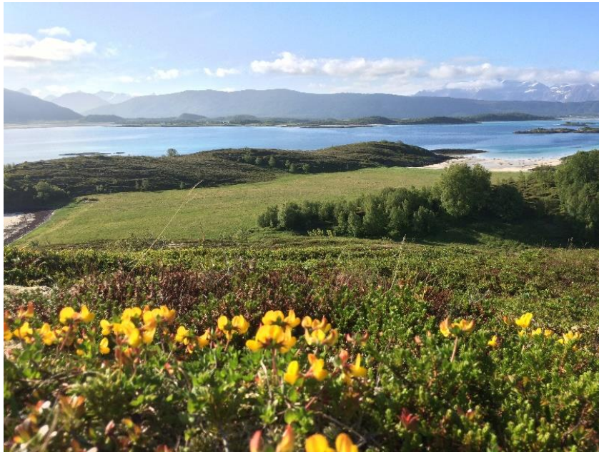
Nattmålsøya, Valsvær