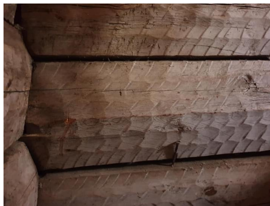
Eldre Uthus på Røssøya med spesiell hoggeteknikk i laftestokkene