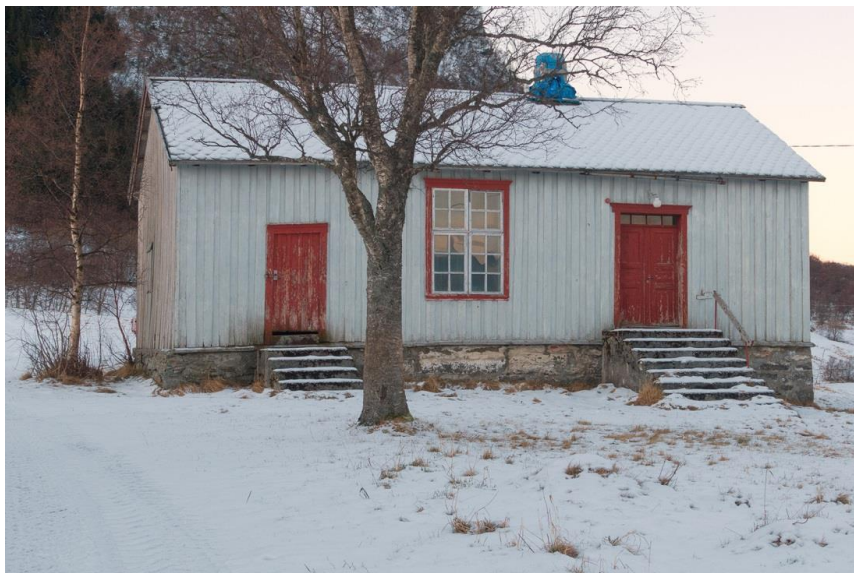
Skagstad skole