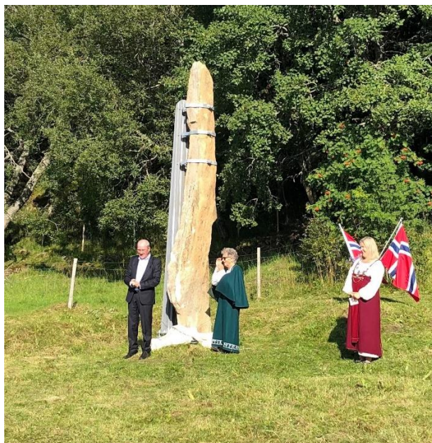
Fra markering av gjenreising av Langsteinen i 2021

restaureringen. Avduking med tilhørende arrangement i regi av historielaget.