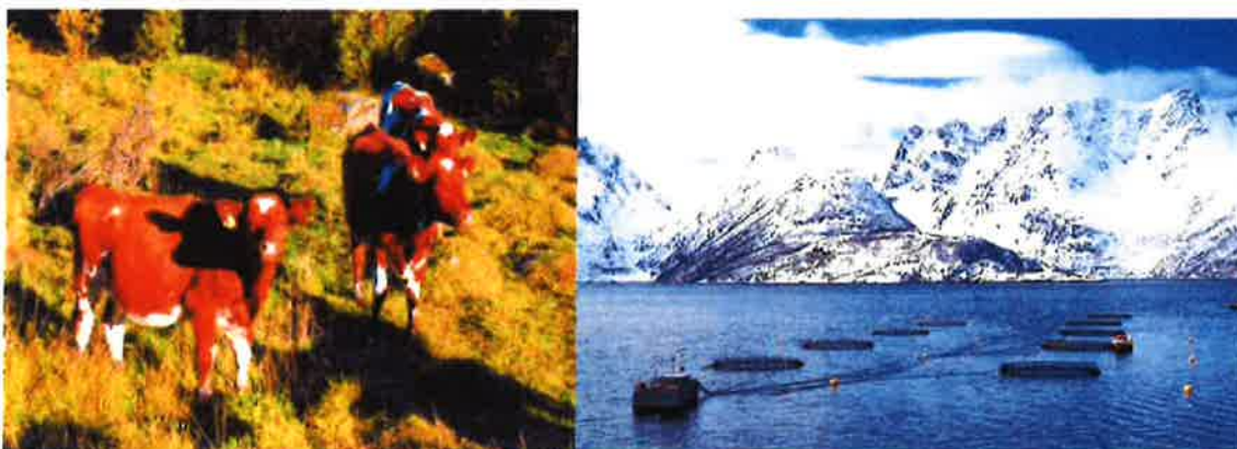
Primærnæringene skaper stabile arbeidsplasser og levende bygder

Avstander er en stor utfordring som er med på å øke kostnaden med å drive rådgiving i Nord-Norge. Samtidig så gir avstandene, klimaet og våre naturgitte forutsetninger store muligheter som den Nord-norske bonden må vite og nyttiggjøre seg av.