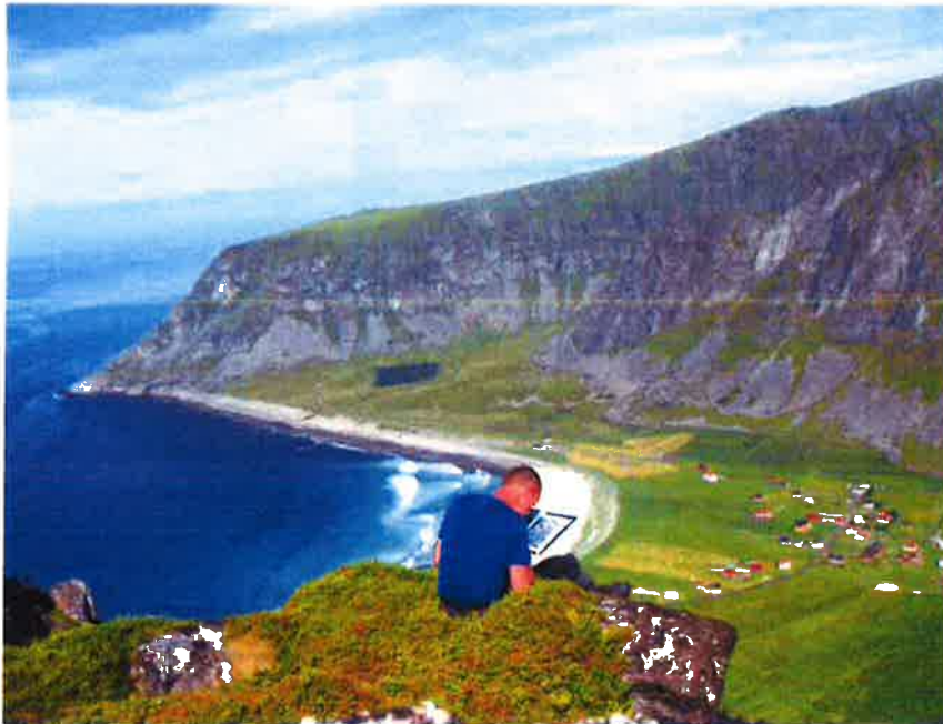
Beitekartlegging er et nyttig redskap for å holde landskapet åpent