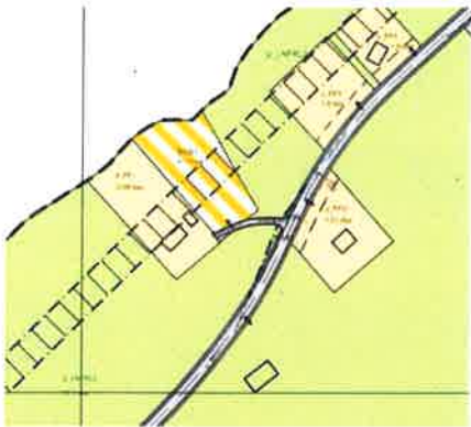
Figur 3 Endret formål BKB1