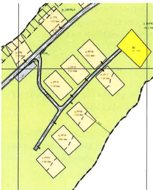
Figur 2 Ny adkomstveg til tomten p_FF14 – 20 og B2