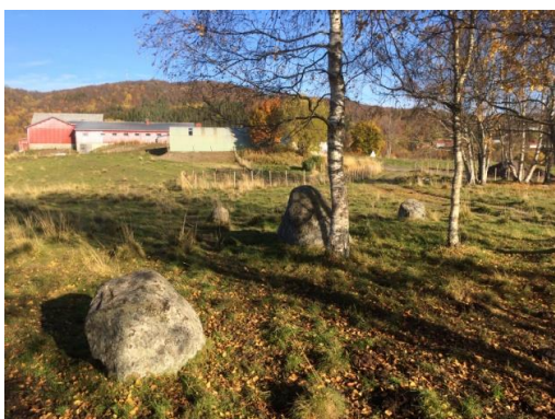
Uteid, tingsteiner ved gravhauger nedenfor gården

Området klassifiseres under tiltaksklasse areal med spesielle verdier og bygdenært.