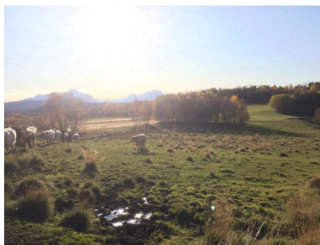
Dyr på beite, område med gravhauger