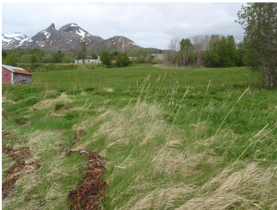
Deler av området, Håsand

Området klassifiseres under tiltaksklasse bygdenært og areal med spesielle verdier.