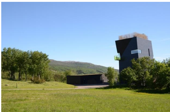
Fulldyrka jord ved Hamsunsenteret

med dyrehold igjen. Ettersom det er noe uvisst om oppstart av husdyrhold og bruk av beitet, velger en heller å prioritere 25 da fulldyrka jord innenfor dette lokale verdifulle kulturlandskapet. Området klassifiseres under tiltaksklasse areal med spesielle verdier og bygdenært.