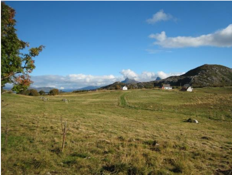
Tysnes høsten 2007