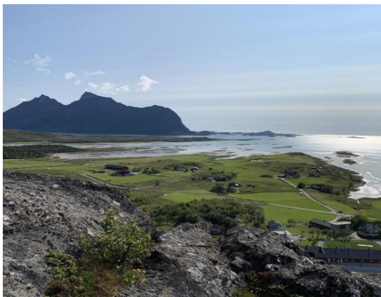
Holkestad sett fra Fløya

Holkestad er et fantastisk kulturlandskap. Bygda ligger åpent og fint til ut mot Vestfjorden, Her ligger er gårdsbrukene på sletta som strekker seg fra sjøen innover mot fjellfoten. Naustrekka ved stranda vitner om livet til feskarbonden. I dette området er det i dag fire aktive gårdbruk med melk og kjøttproduksjon. En har da tatt med eiendommen i Myra. Disse brukene gjør at kulturlandskapet er holdt i hevd både med slått og beiting. Holkestad er mye besøkt i sommersesongen. Hvis en går «Dronningruta» over Fløya ender en opp på Holkestad. På tur ned fra fjellet får man en fantastisk utsikt over det vakre kulturlandskapet som generasjoner har bidratt med å holde ved like. Det er spor etter bosetting fra langt tilbake i tid. Et godt skjøttet kulturlandskap er viktig å ta vare på både for lokalbefolkning og tilreisende. Det er mulig å gå en skogsvei gjennom marka, langs Skånlandsvatnet til Skånland. Området klassifiseres under tiltaksklasse bygdenært og areal med spesielle verdier.