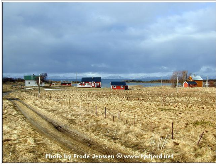
Tysnes før beitestart 2005