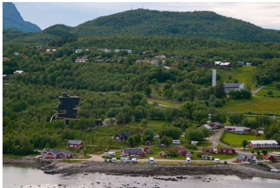
Oversikt deler av Presteid, (hentet fra Internet)