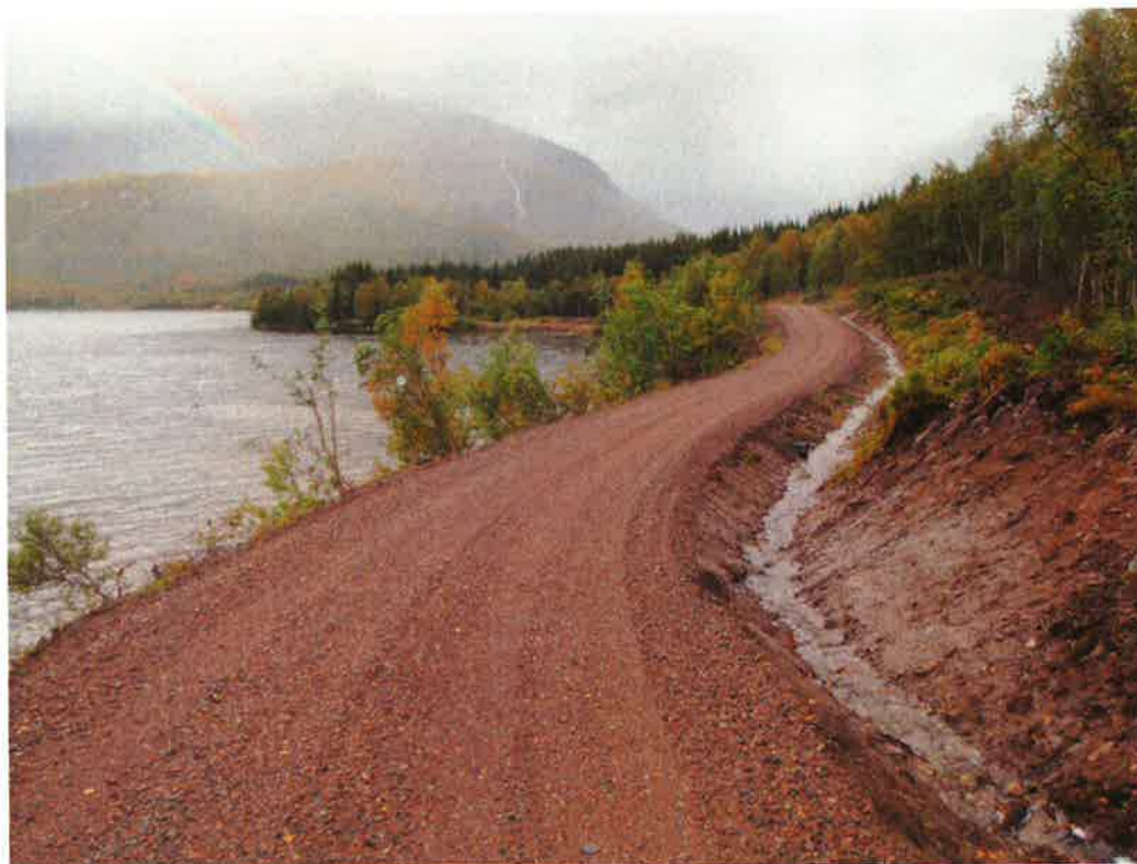
Stokkvassveien Steigen kommune