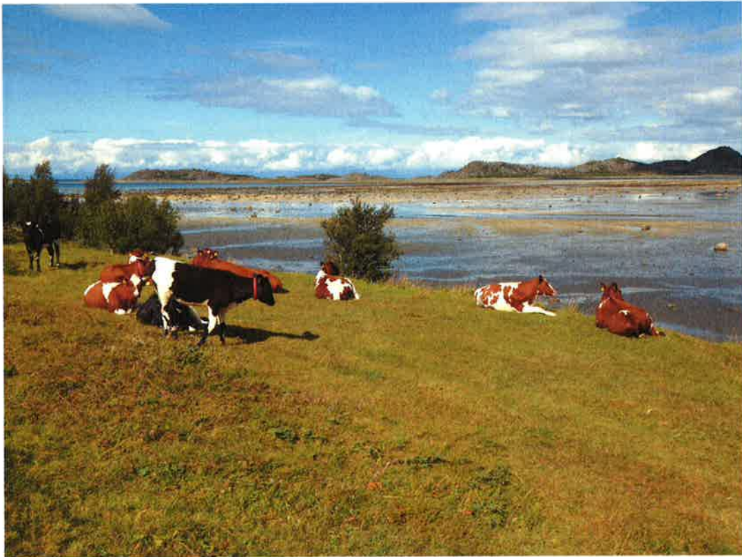
Bø. Steigen kommune

Steigen , Hamarøy og Tysfjord kommuner ønsker å opprettholde et aktivt og bærekraftig landbruk der kulturlandskap og biologisk mangfold er blant de bærende elementer.