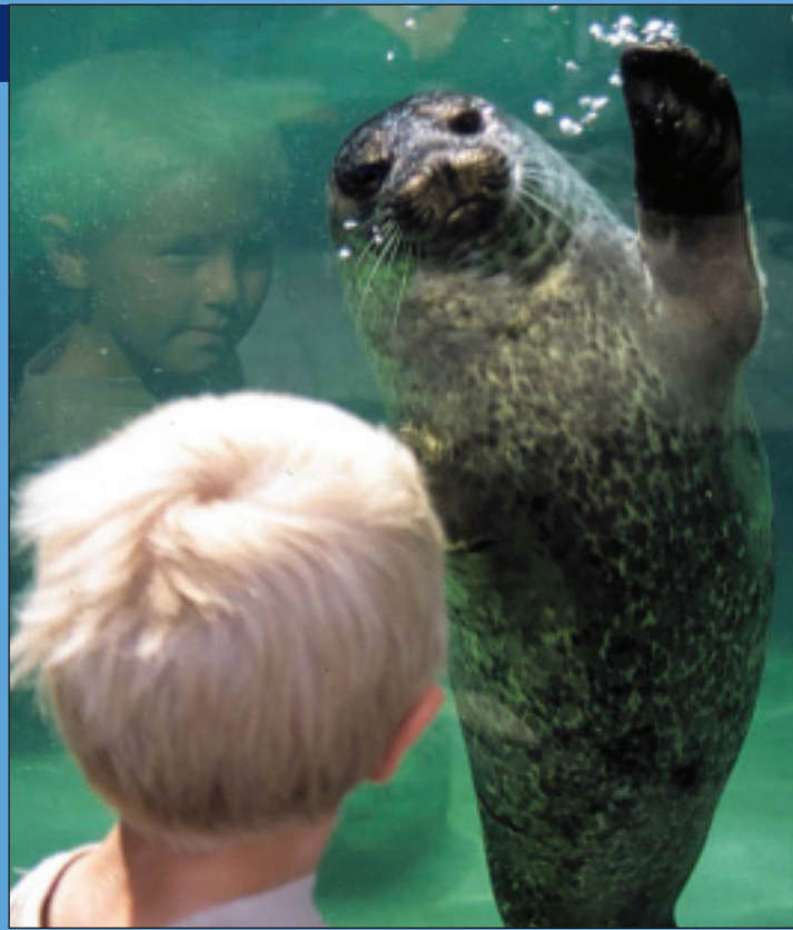
Gutt og sel.

Refusjonsordninger anbefales ikke. Det krever arbeid, slik at vinninga lett går opp spinninga. Mange arrangører og transportører har allerede offentlig støtte. Mener f.eks. en konsertarrangør at en påføres et urimelige tap, kan en eventuelt ha et visst antall plasser for besøkende med ledsager.