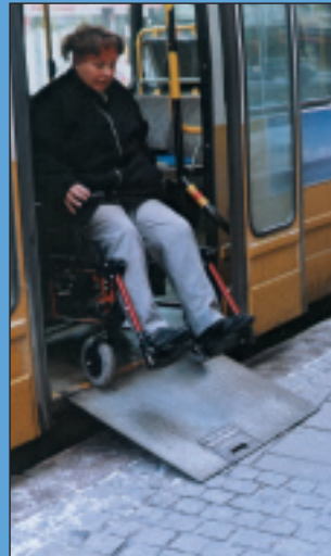
Tilgjengelig buss i Kristiansand.