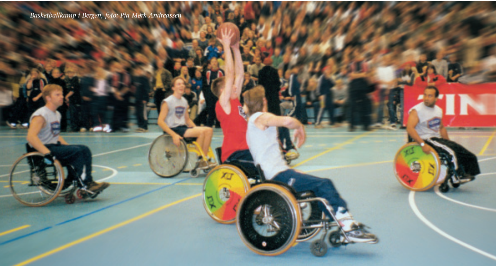
Basketballkamp i Bergen