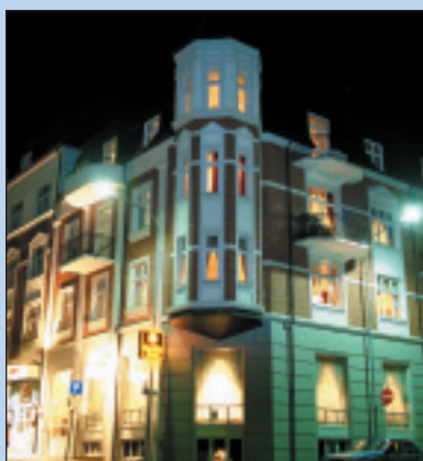
Fra venstre: Simulator i Olympiaparken på Lillehammer, foto: Olympiaparken, Quality Hotel Grand på Gjøvik, foto: Quality Hotel Grand, Raufoss Badeland, foto: Raufoss Badeland.