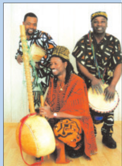
Fra venstre: NSB/tog, Nordlandiahotellet på Karl Johansgate i Oslo, Grappa Sokora turnerer med Rikskonsertene