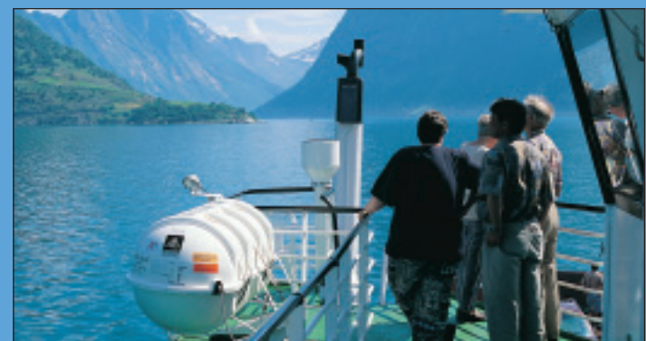
Ferge på Hjørundfjorden.