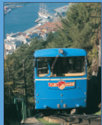
Fløibanen i Bergen.