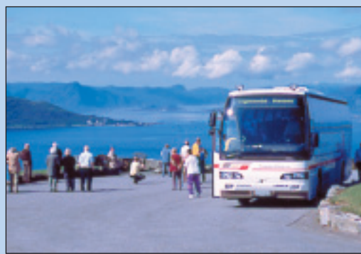
Fra venstre: Spelet om Heilag Olaf på Stiklestad, Verdal, foto: Leif Arne Holme og Stiklestad nasjonale kultursenter. Buss-selskapet TrønderBiler har ruter i hele Nord-Trøndelag, foto: TrønderBiler.