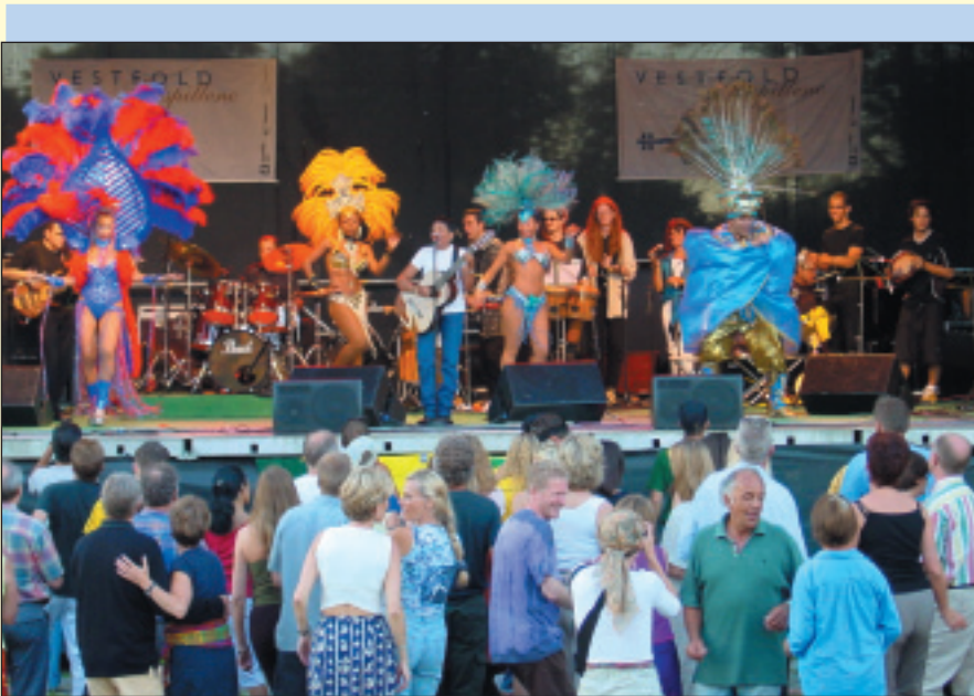
Fra venstre: Vestfold festspillene 2001, «Viva Brasil» konserten på Slottsfjellet i Tønsberg, foto: Vestfold Festspillene, Fergen Larvik-Kristiansand, foto: Color Line, Vestfoldbussene trafikkerer store deler av fylket. Foto: Trond Myhre.