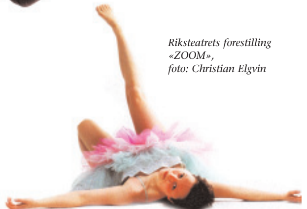
Riksteatrets forestilling «ZOOM»