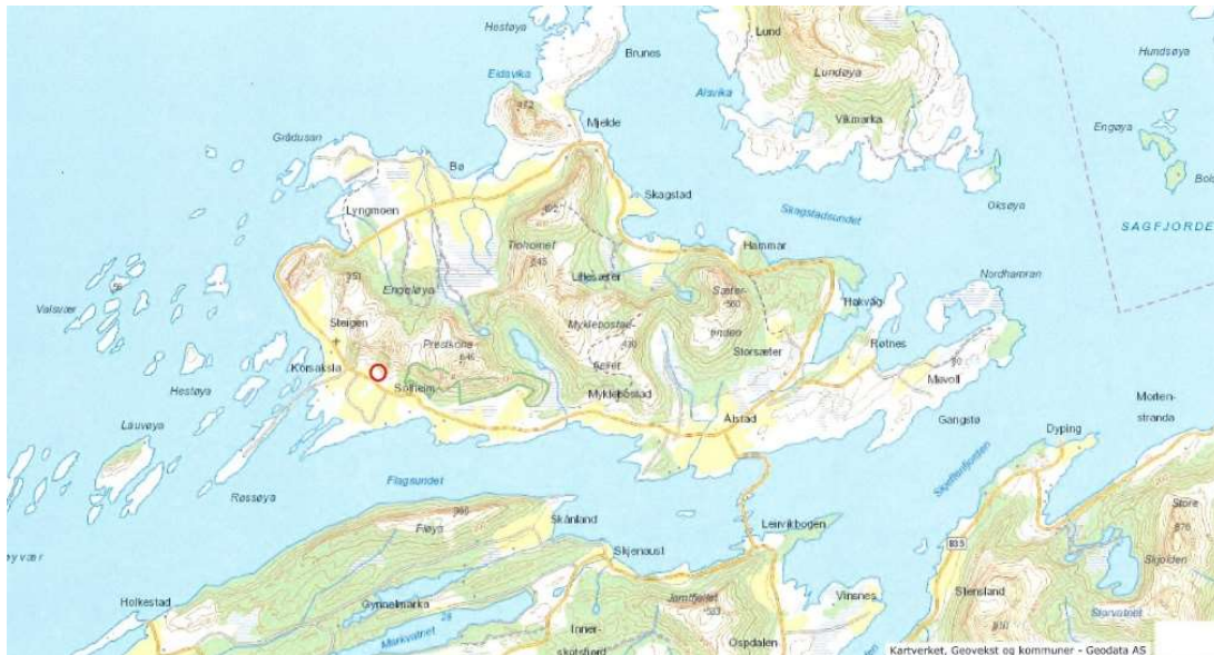
Figur 1. Kartutsnitt over Engeløya med planområdet markert med rød sirkel. Kartunderlag fra Norkart.